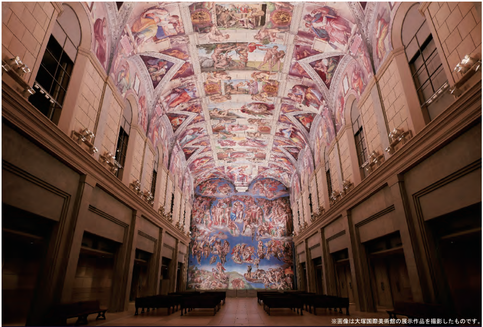
※画像は大塚国際美術館の展示作品を撮影したものです。