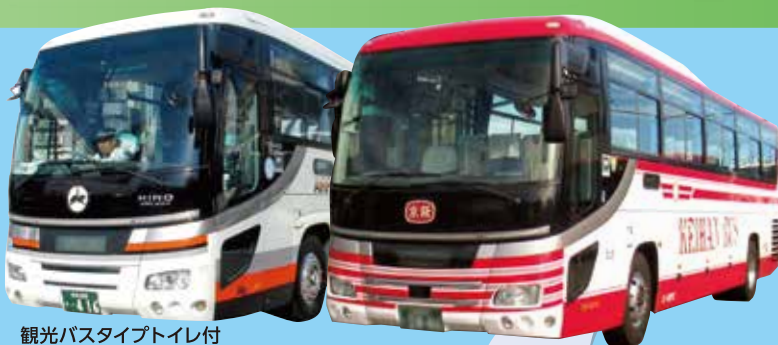
観光バスタイプトイレ付 無料 Wi-Fi設置