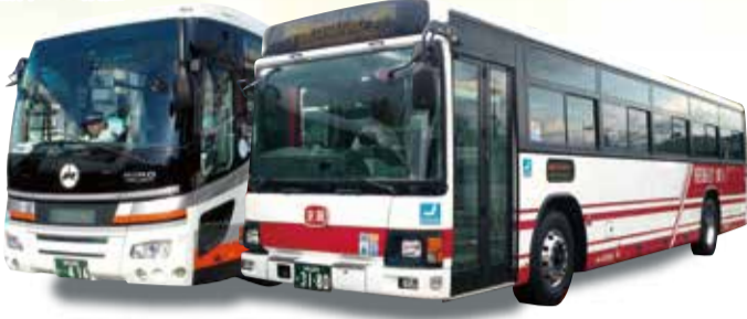
(共同運行会社：奈良交通株式会社)