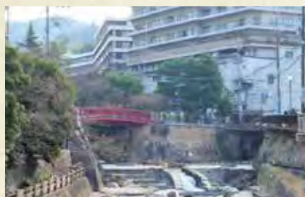
1時間15分で温泉地に直行し、旅行気分を満喫。