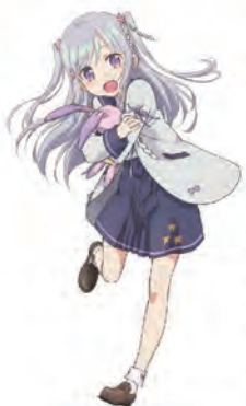
有馬楓花 ARIMA FUUKA