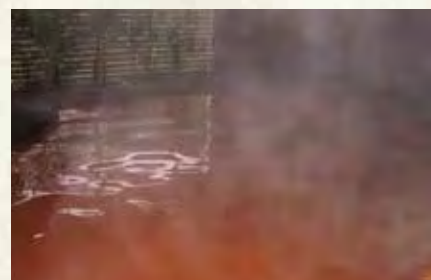
冷え性、腰痛、筋・関節痛、末梢血行障害などに効果がある金泉。