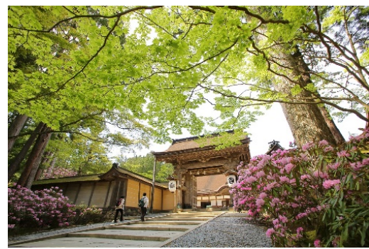
金剛峯寺 新緑